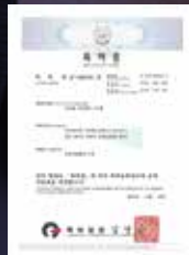
차량용 무인방역 시스템