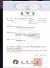
차량 이송용 컨베이어