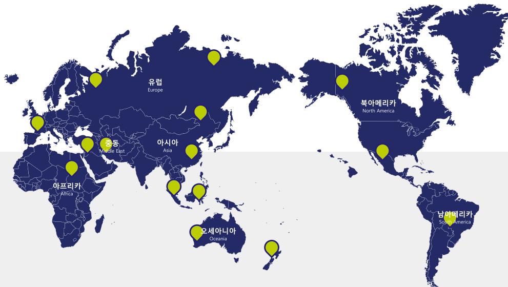
중국, 폴란드 외 18개국