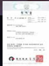
대형 차량용 세척장치